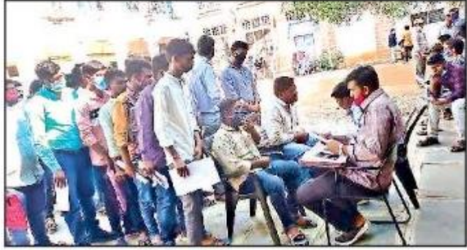
విద్యార్థులను ఎంపిక చేస్తున్న అధికారులు

అనంతపురం విద్య, న్యూస్ టుడే: జిల్లా గ్రామీణాభివృద్ధి సంస్థ- సీడాప్ ఆధ్వర్యంలో మంగళవారం నిర్వహించిన ఉద్యోగమేళాలో 235 మంది ఉద్యోగాలకు ఎంపికయ్యారు. స్థానిక ఆర్ట్స్ కళాశాలలో మౌఖిక పరీక్షలు నిర్వహించారు. 587 మంది నిరుద్యోగ యువత మౌఖిక పరీక్షకు హాజరయ్యారు. వివిధ బహుళజాతి సంస్థలు పాల్గొన్నాయి. ధన్విలోన్స్ సంస్థకు 45 మంది, ఎస్ఐఎస్ సెక్యూరిటీస్ 45, వైఎస్కే ఇన్స్టిట్యూట్ 40, హుందాయ్ మూవీస్ 15, ఇనోసోర్స్ ఉడన్ 30, ఇనోసోర్స్ ఎస్బీఐ 60 మందికి ఉద్యోగాలు కల్పించాయి.